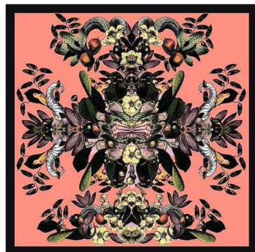
Foulard «Paradiso», Seide, 135 cm x 135 cm (230 Fr.), von Foulalà.