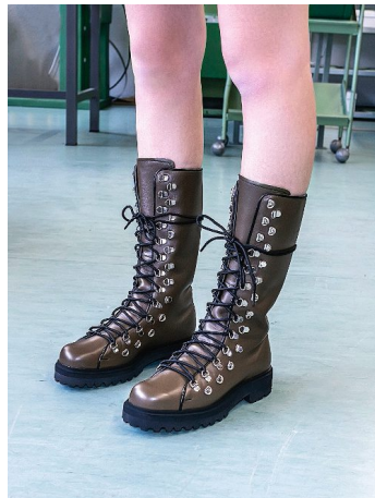
Schnürstiefel «Viator Two», Nappa-Leder (1490 Fr.), von KDH1932.