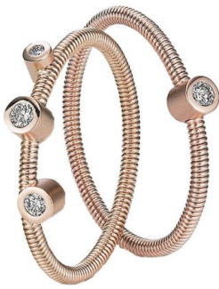
Ringe «Artist», Brillanten und Gold (ab 700 Fr.), von Niessing.