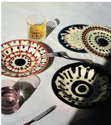
Handbemalte Porzellanteller (ab 32 Fr.), von L'Elefantino.