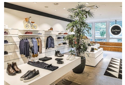
Der neue Herren-Concept-Store LesDeux Men in Zug.

Ein Kleiderladen? Ein Barbershop? Ein Feinkostgeschäft? Der neue Herren-Concept-Store LesDeux Men in Zug ist von allem ein bisschen. Nebst Weinen und Spirituosen, City-Bikes und Interior-Produkten findet Mann hier Kleider und Accessoires – von modisch bis zur Masskonfektion. Ein Barber, Kosmetikbehandlungen und Massagen runden das ultimative Einkaufserlebnis ab. (kid.)