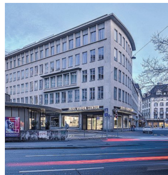
Das Zeiss Vision Center liegt im Herzen der Zürcher Innenstadt.